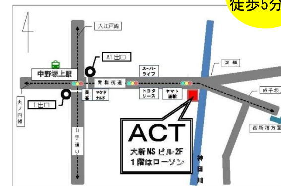
東京メトロ丸ノ内線・都営大江戸線「中野坂上駅」 出口1 A1出口より徒歩約5分